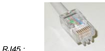
Tabuľka č.1: Rozhranie IEEE 802.3 - priradenie vývodov